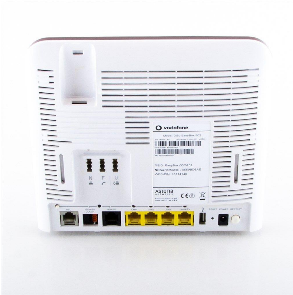
Router easybox 802 4G LTE posiada 3 x USB 2.0

Możesz rozdzielić sygnał 4G LTE / 3G ( każdą sieć ) każdą kablówkę , TAK KAŻDĄ UPC , Vectra, Multimedia, Toya ASTER Ret Sat Virtual Line, Osiedlowe i inne Jeśli masz Neostredę, Netię lub Dialog i modem z wyjściem RJ45 to też będzie działać